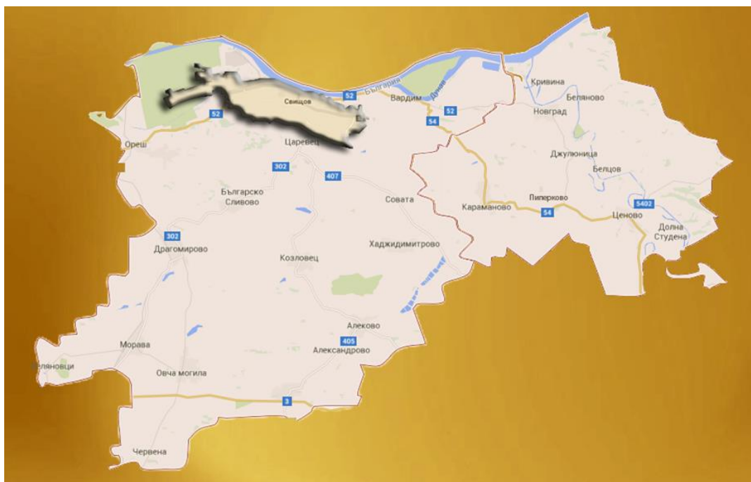
Приложение 1: Карта на територията на СНЦ „МИГ Ценово – Свищов“ (с приспадане гр. Свищов – регулация)

Териториалният обхват на СНЦ „МИГ Ценово-Свищов“ е изцяло съобразен с изискванията на чл. 5, ал. 6 и ал. 7 от Наредба №22 и, както е видно от Приложение 1, не покрива гр. Свищов – център на Общината в строителните му граници. Общата площ на територията на МИГ-а е 865,48 км 2 и не включва урбанизираната територия на гр. Свищов от 9,72 км 2 . Общата площ на територията на двете общини е 875,2 км 2 .